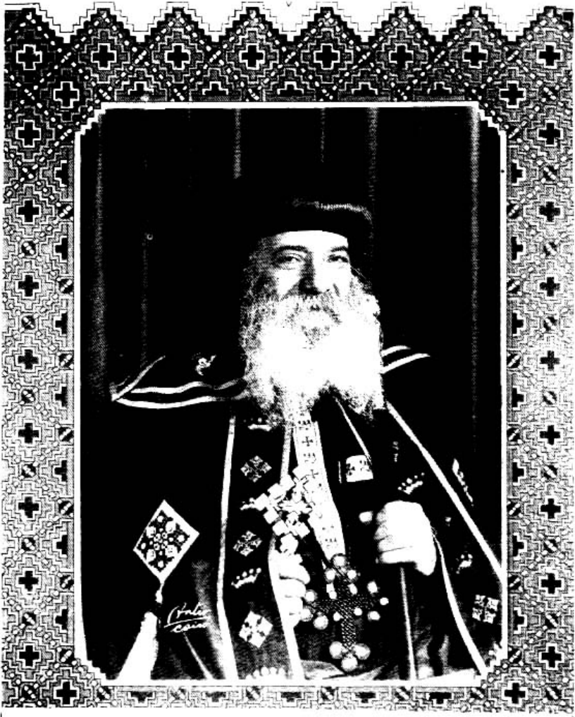
قداسة البابا شنودة الثالث بابا الإسكندرية وبطريك الكرازة المرقسية