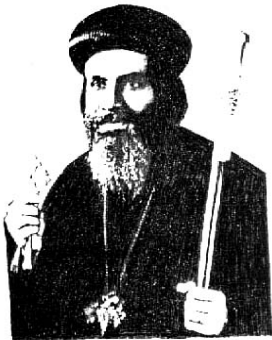
الأنبا يمين أسقف ملوى وأنعنا والأشمونين